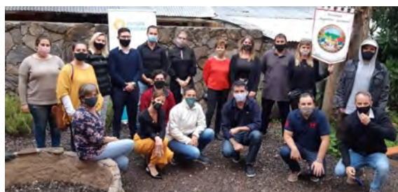
Summer Meet Up en Villa General Belgrano, Córdoba, abril 2021

Para darle mayor importancia a la equidad de género dentro de sus propias asociaciones, sugerimos la creación de una figura de Representante de Asuntos de las Mujeres, con participación en la Comisión Directiva.