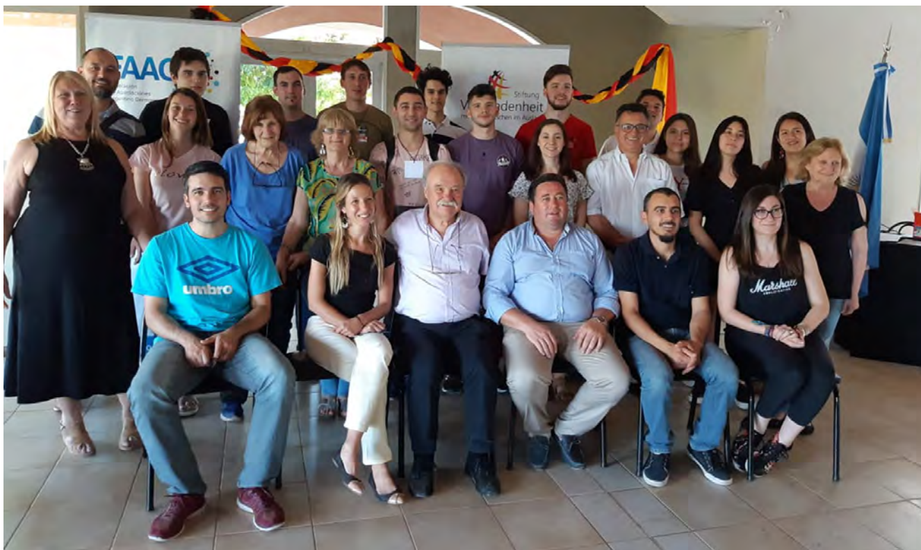
Taller en Paraná, Entre Ríos, noviembre 2019

Las asociaciones, a lo largo de su historia, han desarrollado diversas actividades sociales que han tenido un impacto positivo en sus comunidades: colecta y distribución de alimentos y/o indumentaria, huertas ecológicas, asistencia a niñas y niños en situación de calle, asistencia a adultos mayores, entre otras.