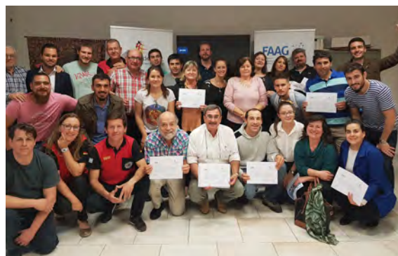
Taller en Resistencia, Chaco, agosto 2019

Siempre recomendamos informarse sobre las propuestas del instituto oficial de cultura e idioma Goethe Institut y sus instituciones afiliadas ( Kulturzentren ), que ofrecen una variedad de cursos para todos los niveles y en diversos formatos.