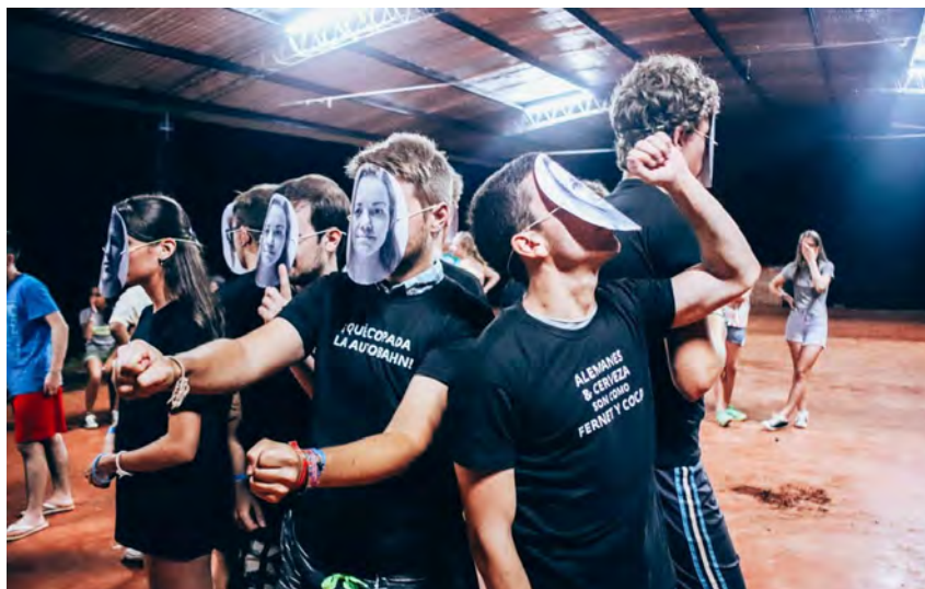
El proyecto #NOESTANASI de miembros de #JungesNetzwerk en el “Deutschcamp” de YFU, Misiones 2020

Frente a esta nueva incorporación de elementos a la “vida cultural alemana”, nuestras instituciones tienen la posibilidad de modernizarse en la oferta cultural que cada entidad pueda ofrecer a la comunidad en general. Es decir, no solamente se trata de mantener vivo el fuego de las tradiciones de nuestros antepasados, sino también de entender la posibilidad de que jóvenes se sientan interpelados y atraídos por nuevos conceptos que Alemania brinda hoy en día al mundo.