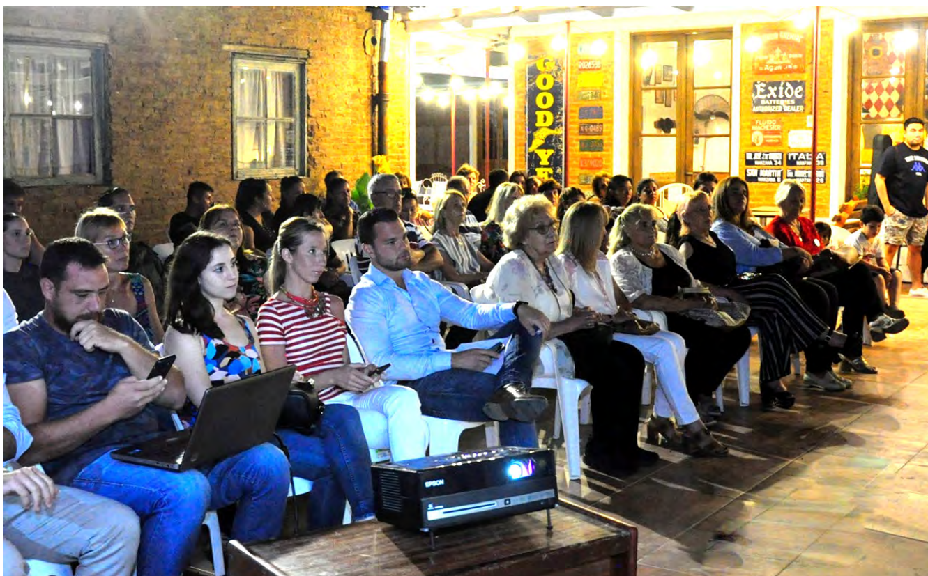
Conmemoración de la Caída del Muro de Berlín en San Justo, Santa Fe, noviembre 2019

Las actividades culturales de una asociación son un eje fundamental, ya que crean un marco para la integración de distintas generaciones dentro de las instituciones y de la comunidad de la que forman parte. Estas actividades fortalecen el sentimiento de pertenencia y compromiso de los miembros.