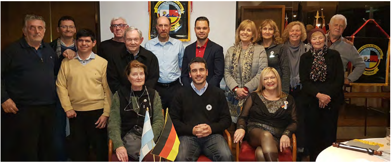
Taller en el Centro Alemán de Mar del Plata, marzo 2019

La pluralidad es una temática que engloba la apertura institucional de las asociaciones, su compromiso y trabajo en los procesos de fortalecimiento democráticos, el involucramiento en tareas de pacificación social y el respeto a la diversidad de género y opiniones que puedan confluir en una institución.