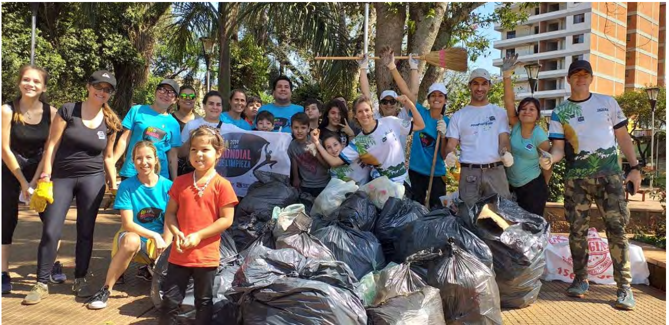
Día Mundial de la Limpieza en Eldorado, Misiones, septiembre 2019

La temática ambiental va tomando cada vez más fuerza en la agenda mundial y Alemania es pionera en el desarrollo de actividades en materia de protección de medioambiente, cumpliendo un rol importante en la transición energética y en la generación de energías limpias y no contaminantes. Por este motivo, representa un campo de gran interés para el desarrollo de proyectos institucionales.