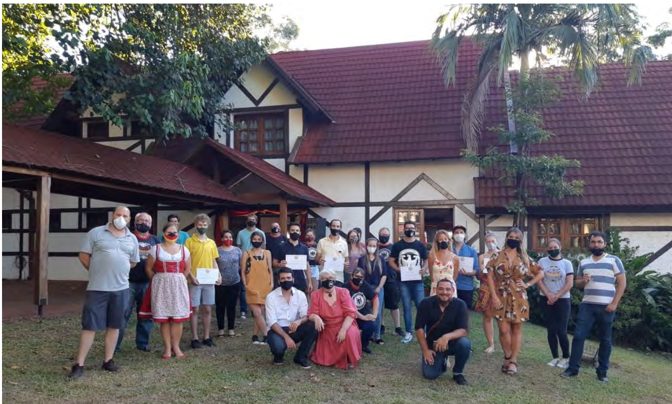
Summer Meet Up en Oberá, Misiones, marzo 2021

La enseñanza del idioma alemán sigue siendo el punto crítico de muchas de nuestras asociaciones. Esto no se debe a una falta de interés en transmitirlo, sino a que a veces resulta imposible encontrar profesores/as que lleven adelante esta iniciativa.