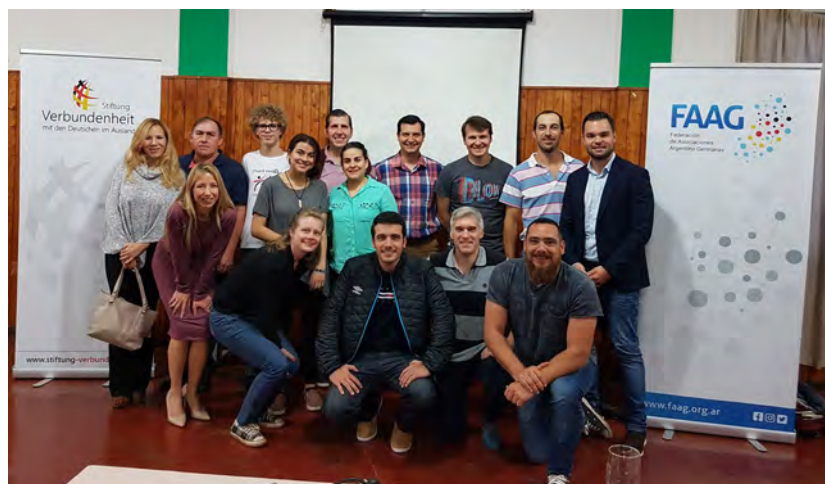
Taller en Eldorado, Misiones, noviembre 2019

El trabajo social también brinda la oportunidad de recibir voluntarias y voluntarios tanto locales como de Alemania. Existen numerosos programas de voluntariado e intercambio con los que las asociaciones pueden colaborar.