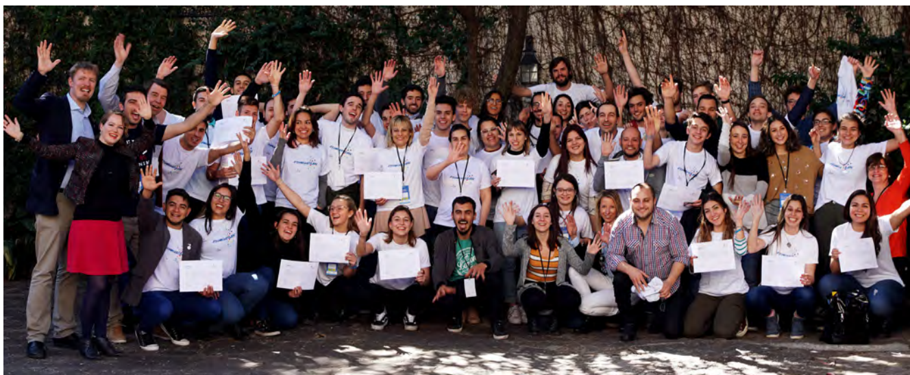
Primer encuentro de miembros de la red #JungesNetzwerk en Rosario, Santa Fe, agosto 2019

La juventud es sin duda un área clave dentro de toda institución. La posibilidad de que una entidad cuente con jóvenes en sus filas abre la puerta a una infinidad de oportunidades de crecimiento institucional y diversificación de actividades. Es por esto que promover la interacción con los jóvenes es una tarea fundamental.