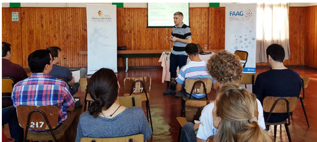
Taller en Eldorado, Misiones, agosto 2019