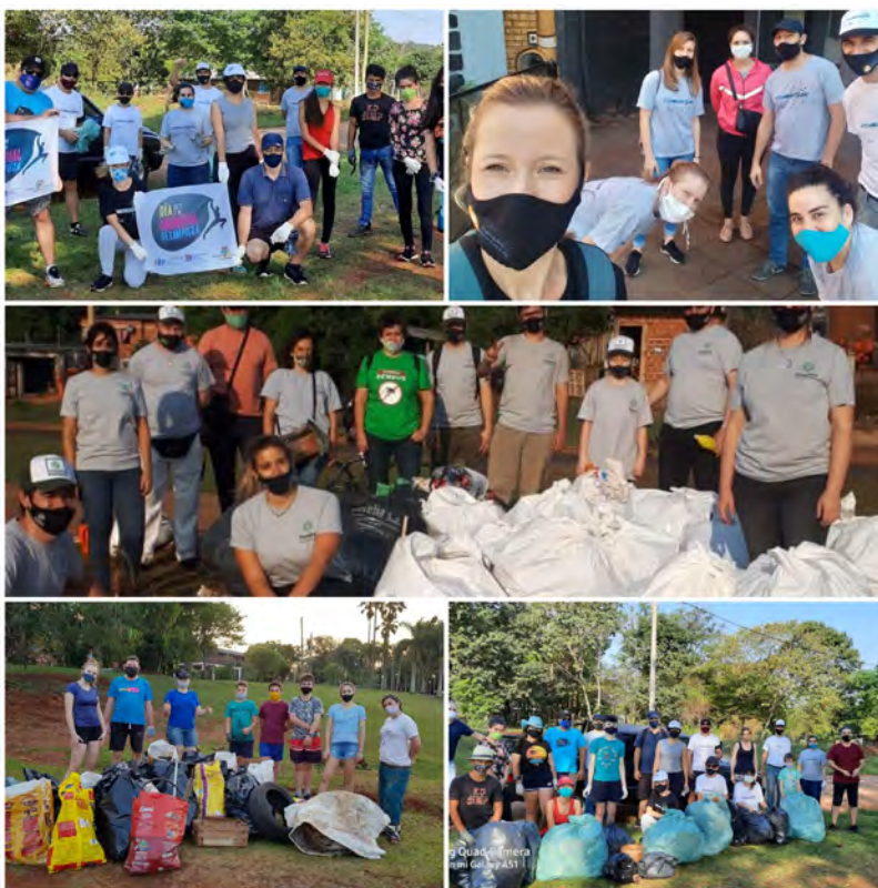
Día Mundial de la Limpieza en Eldorado, Misiones, septiembre 2020