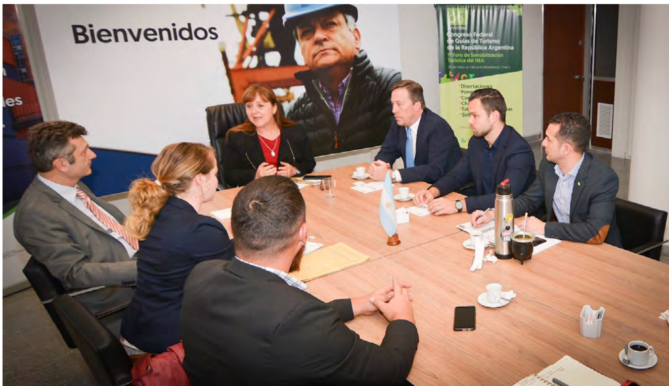
Reunión entre representantes de la Embajada de Alemania, del Gobierno de la Provincia de Chaco y de la F.A.A.G., Buenos Aires, septiembre 2019

La economía ocupa un lugar preponderante en el mundo actual. La posibilidad de conectar la vida institucional con el mundo empresarial podría brindar a las asociaciones la oportunidad de adoptar un nuevo rol en el área de la promoción comercial.