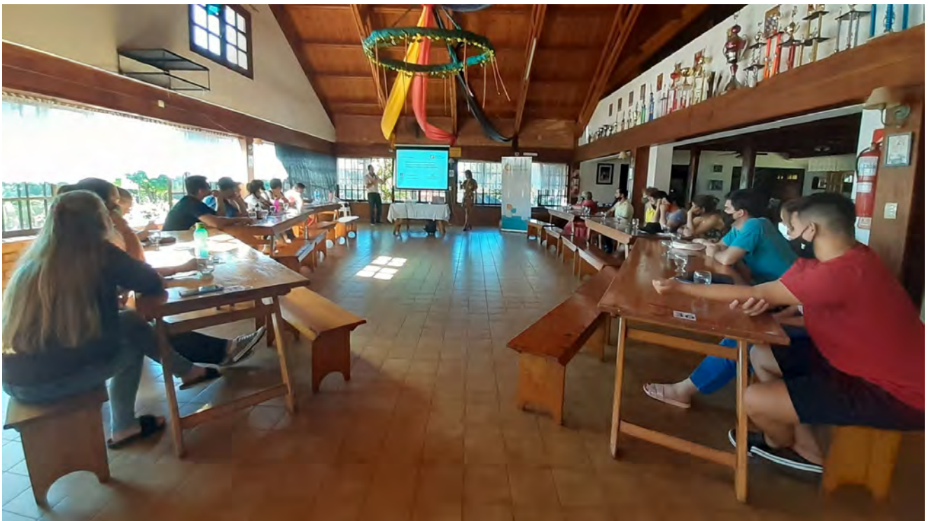
Summer Meet Up en Oberá, Misiones, marzo 2021